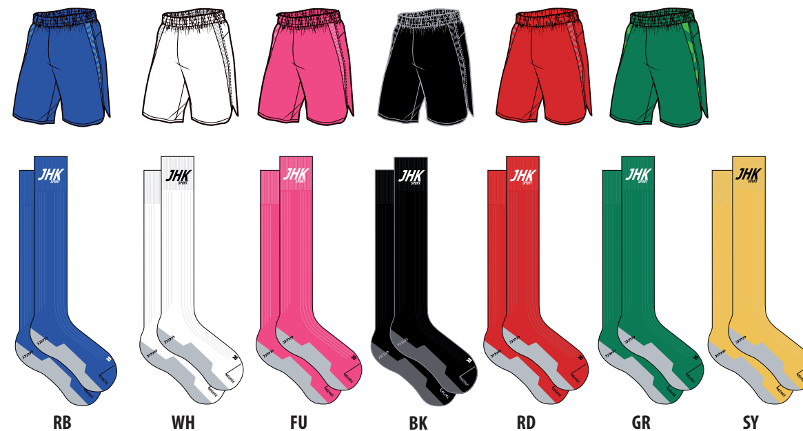
RB WH FU BK RD GR SY

Calcetines de adulto y niño. Logo JHK en un lateral. Adult and kid socks. JHK logo on the side.